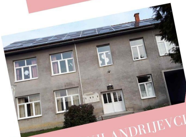
PRO GORNJI ANDRIJEVCI