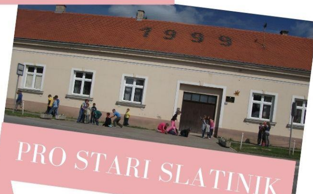
PRO STARI SLATINIK