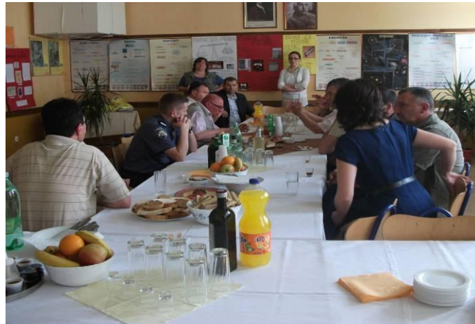
Radni sastanak i dogovor u vezi on-line testiranja