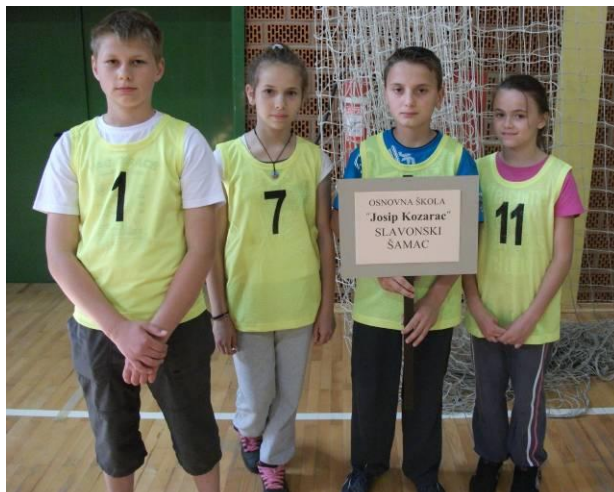
OŠ «Josip Kozarac» Slavonski Šamac